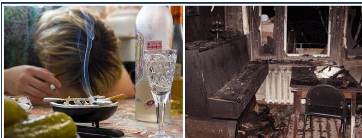
КУРЕНИЕ В СОСТОЯНИИ ОПЬЯНЕНИЯ – ЧАСТАЯ ПРИЧИНА ПОЖАРОВ И ГИБЕЛИ ЛЮДЕЙ

Курение в постели, особенно в нетрезвом состоянии — это верный путь к гибели.